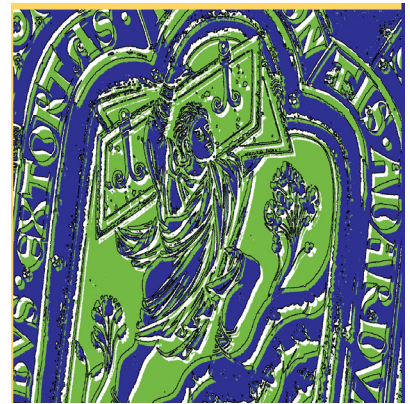
Simson trägt die Stadttore von Gaza weg (Richter 16, 3), Ausschnitt aus dem Klosterneuburger Altar, 1181