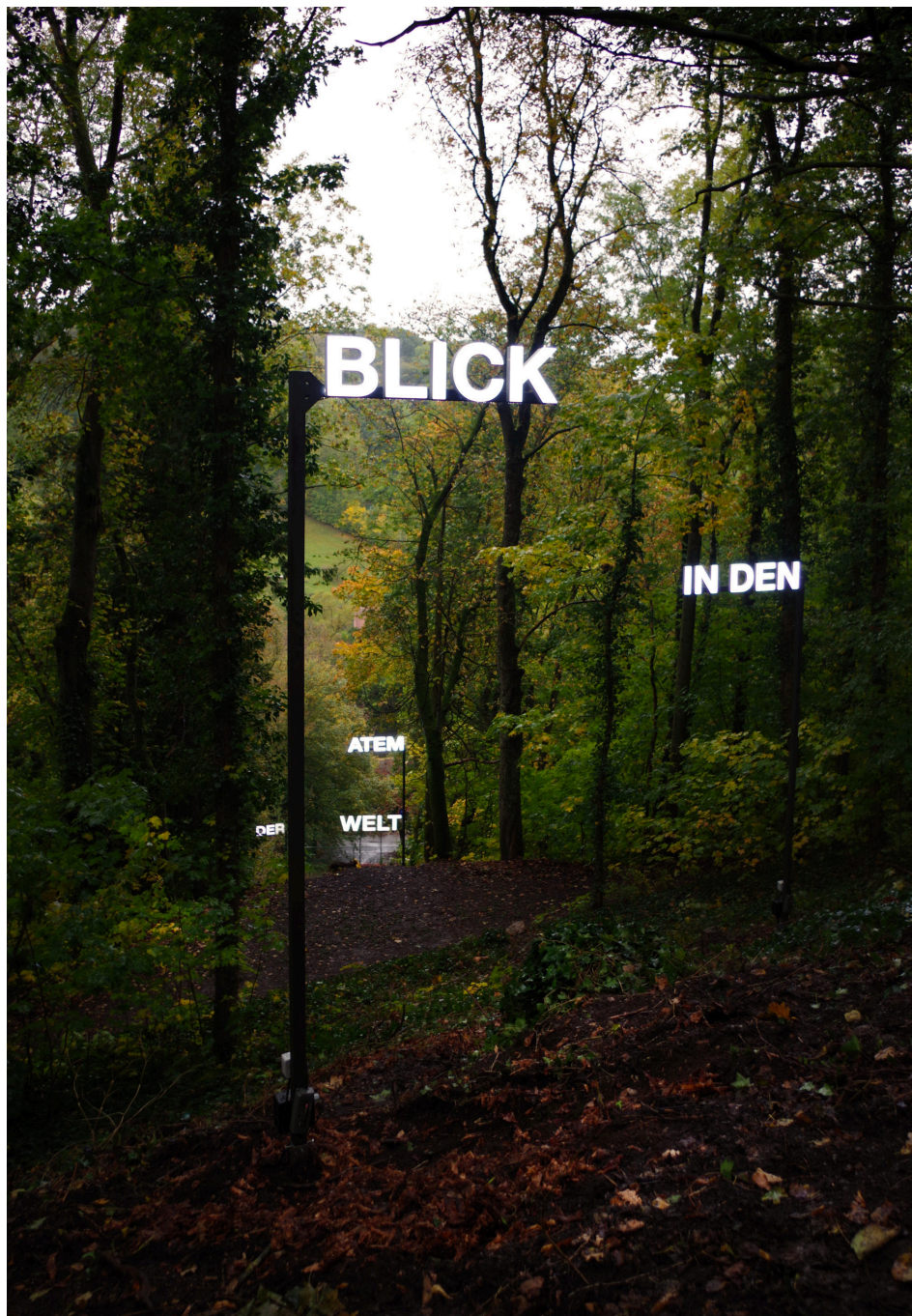
Breathe Earth Collective, Blick in den Atem der Welt, Installation im Park, Wildbad Rothenburg, 2020