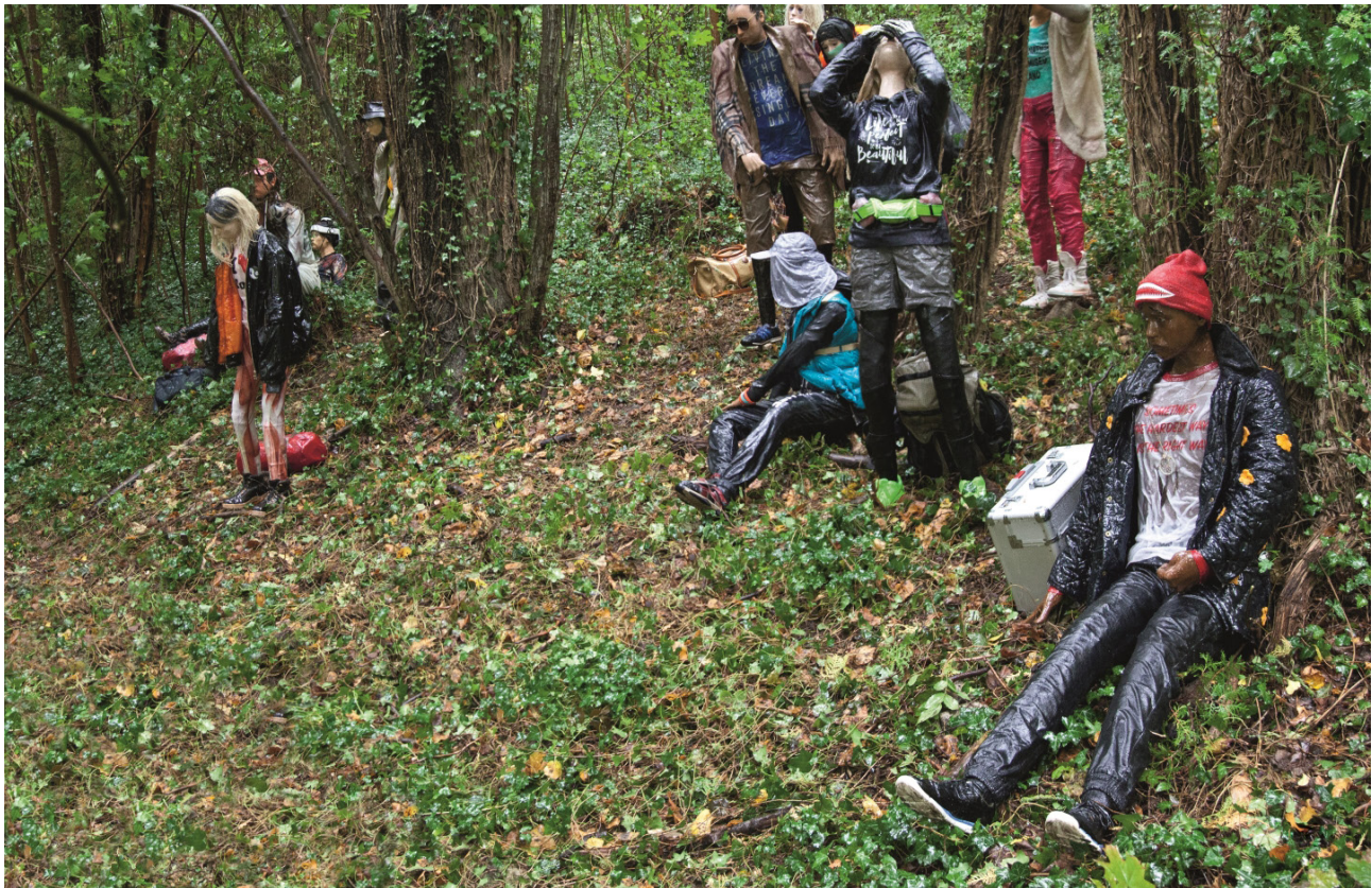
Figurengruppe des Künstlerduos Böhler und Orendt 2017 im Park, Wildbad Rothenburg