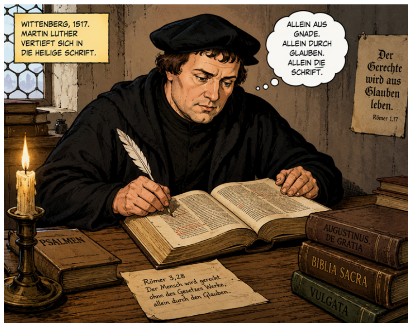
Luther beim Lernen - mit KI(ChatGPT) generiert

Anmeldung: https://theologisches-studienseminar.de/?page_id=1269 oder sekretariat@velkd-pullach.de